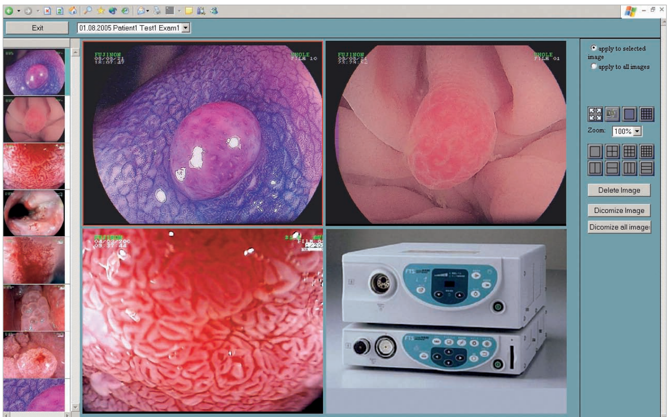
Klar strukturiert: die Ansicht der Befundbilder im DIG.